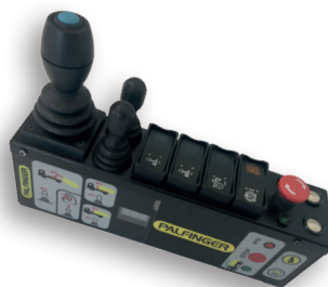
Pro Active Drive