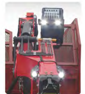
탑시트 및 아우터봄에 4개의 작업등