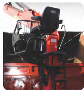
측면 조종석 탑시트(피아노/조이스틱 타입) 및 사다리