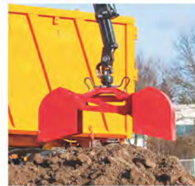
EPSILON 클램셸 버킷