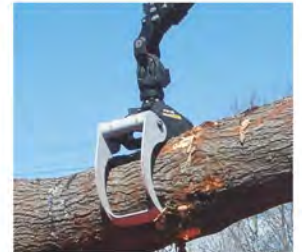
EPSILON 팀버 그랩