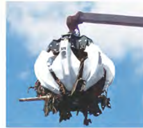
EPSILON 스크랩 그래플