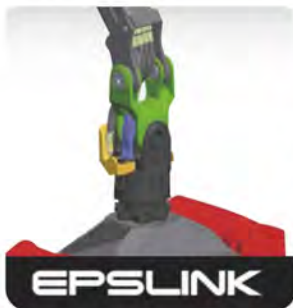
EPSSLINK 엡스링크 - 완벽한 호스가이드 로테이터와 견고하게 연결된 4-eye-cast link