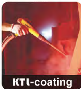
KTL-coating KTL - 가장 진화된 전처리 및 분체 도장