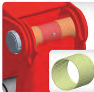
윤활 채널이 있는 고품질 황동 부상 베어링