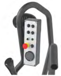
EPSILON 콤포트 패키지