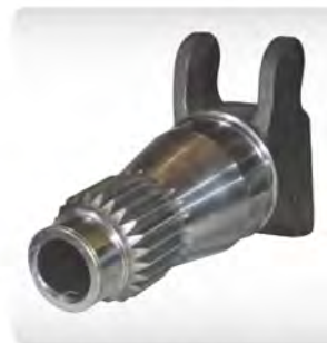
견고한 주물형 크레인 컬럼