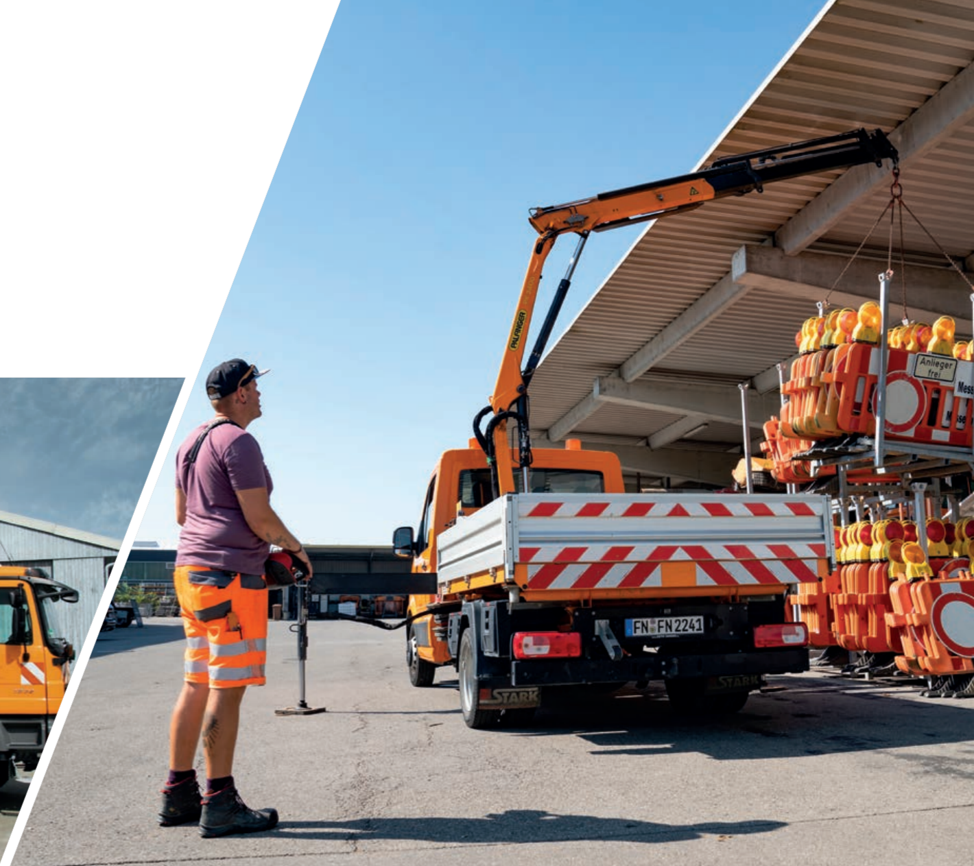
PK 3400 auf 5,5t Fahrgestell