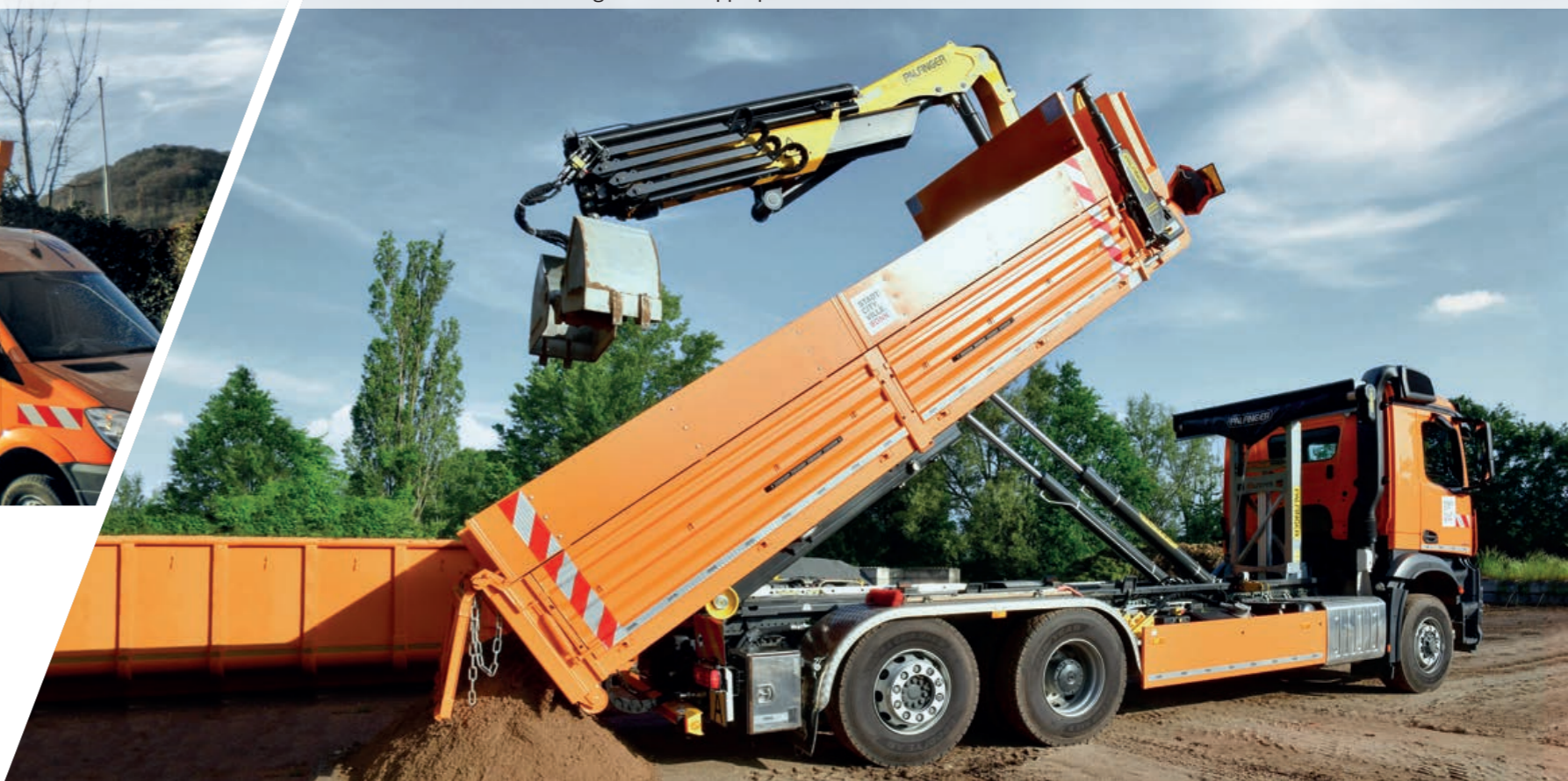
TELESCOPIC T20 auf 26t Fahrgestell und Kipperplateau mit Ladekran PK 14.501K SLD 5