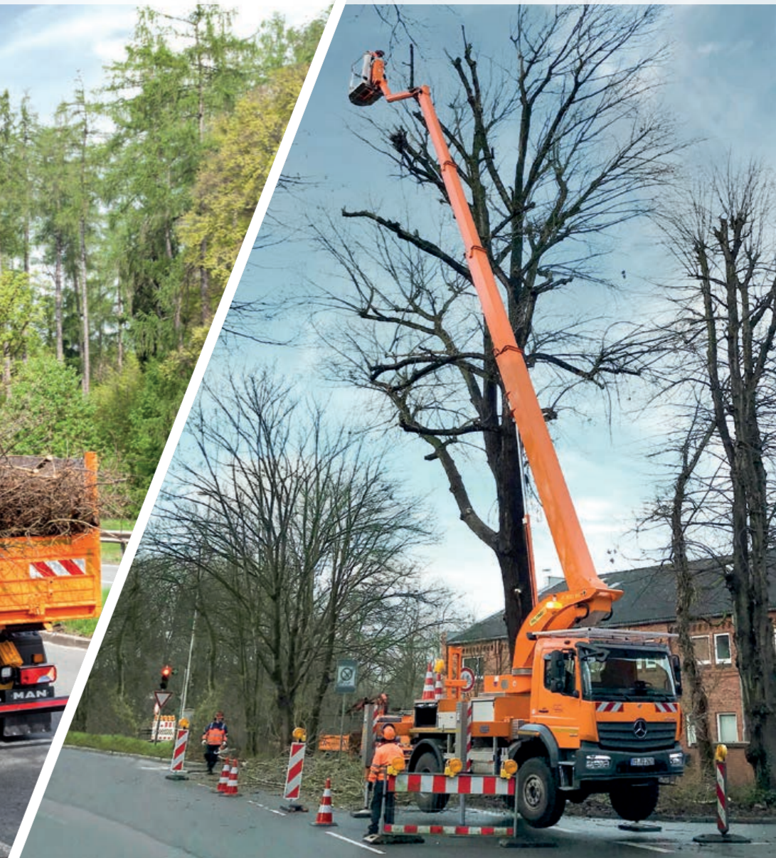
P 300 KS auf 18t Fahrgestell