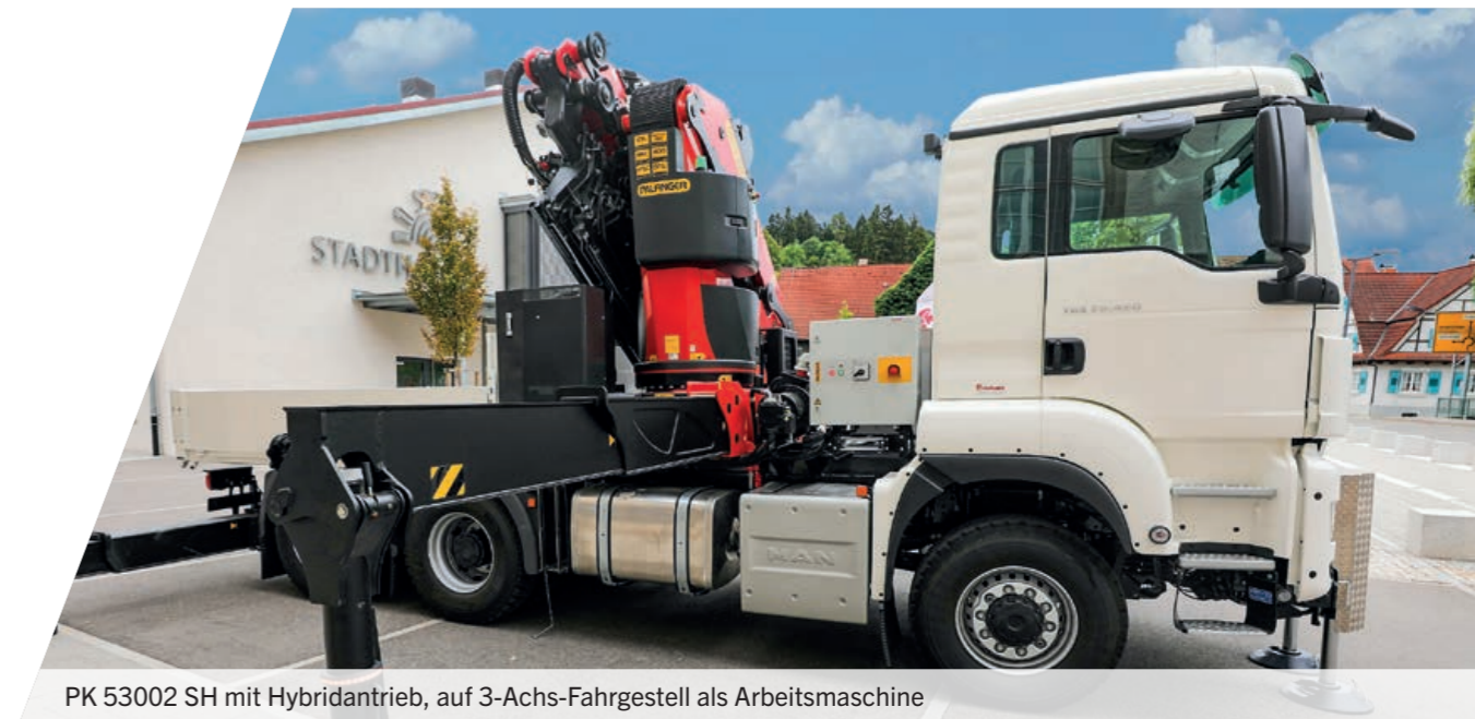
PK 53002 SH mit Hybridantrieb, auf 3-Achs-Fahrgestell als Arbeitsmaschine