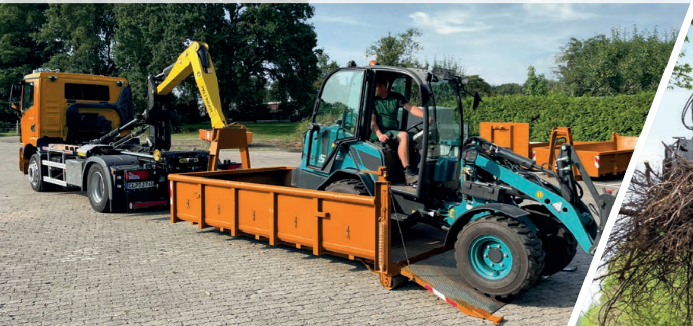
TELESCOPIC T15A auf 15t Fahrgestell