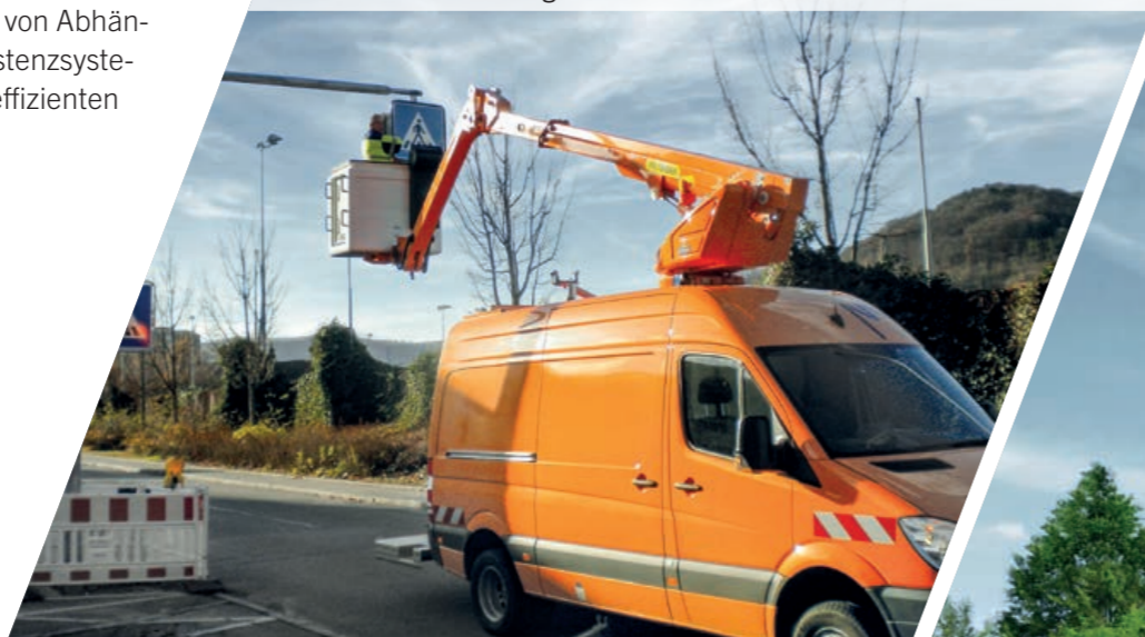
PD 140 V auf Kastenwagen