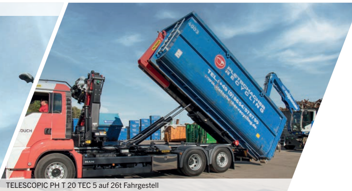
TELESCOPIC PH T 20 TEC 5 auf 26t Fahrgestell