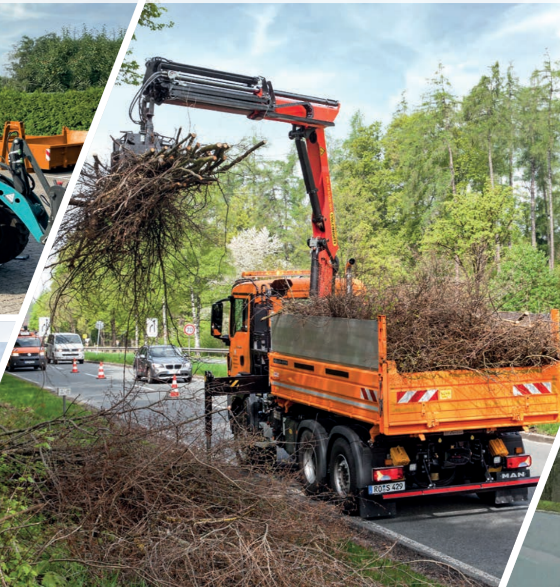
PK 14502 SH auf 26t Krankipper