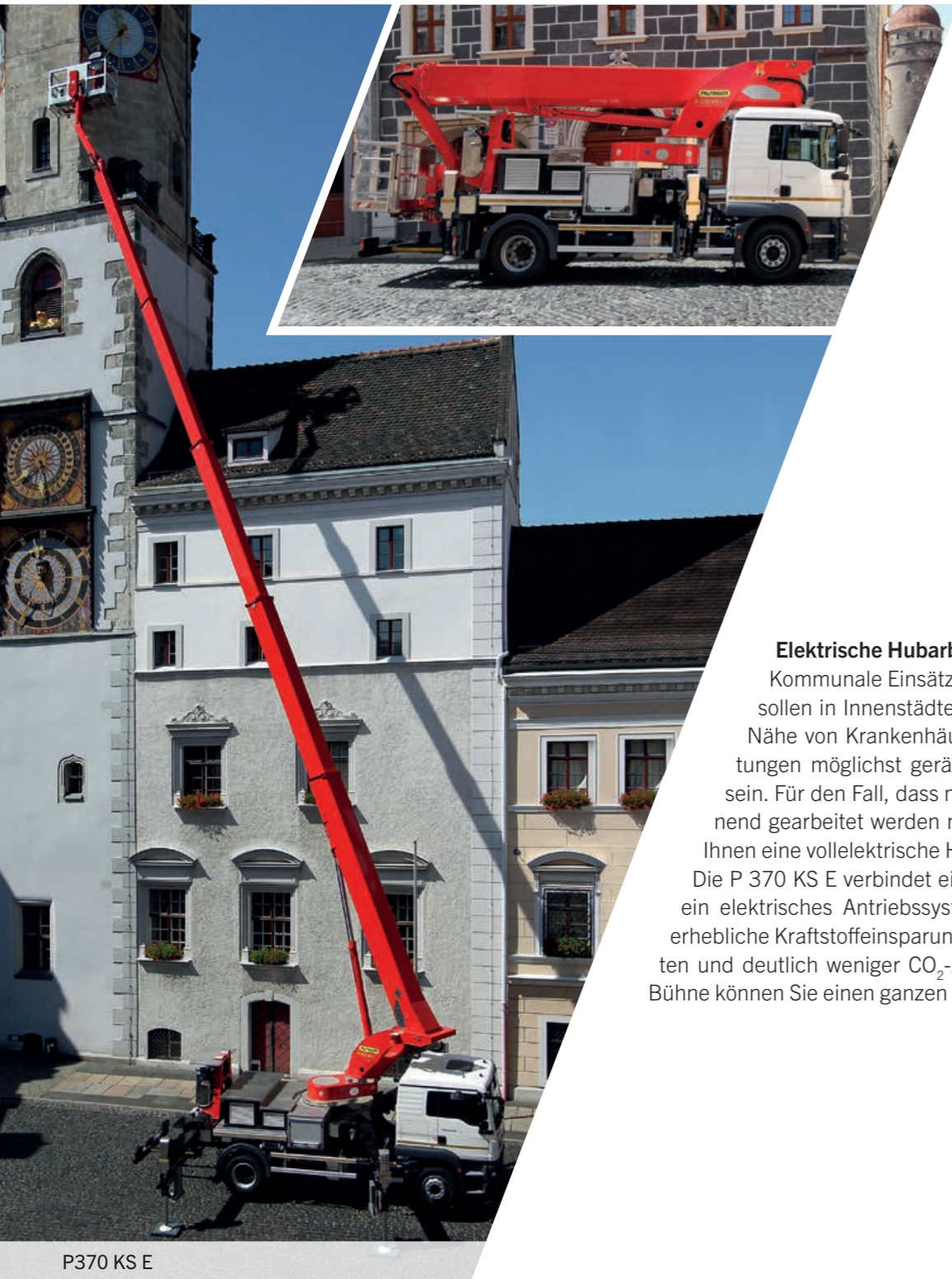
P370 KS E