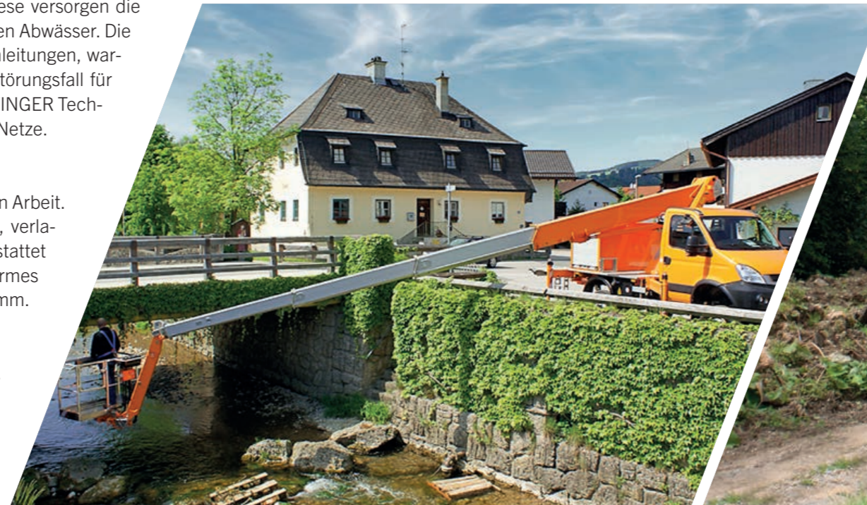
P 250 BK auf 3,5t Fahrgestell

Bei der Energieversorgung müssen Ihre Spezialisten in die Höhe, z. B. zur Wartung von Isolatoren oder Aggregaten an Strommasten. Bei Arbeiten unter Hochspannung schützt sie ein isolierter PALFINGER GFK-Korb. Durch Komfortfunktionen wie die automatische Niveauregulierung oder die „Home-Funktion“ lassen sich die Hubarbeitsbühnen schnell und sicher aufstellen oder automatisch in die Transportstellung zurückbringen. Ist die PALFINGER Hubarbeitsbühne auf einem Allradfahrzeug aufgebaut, sind auch Arbeiten in schwierigem Gelände möglich.