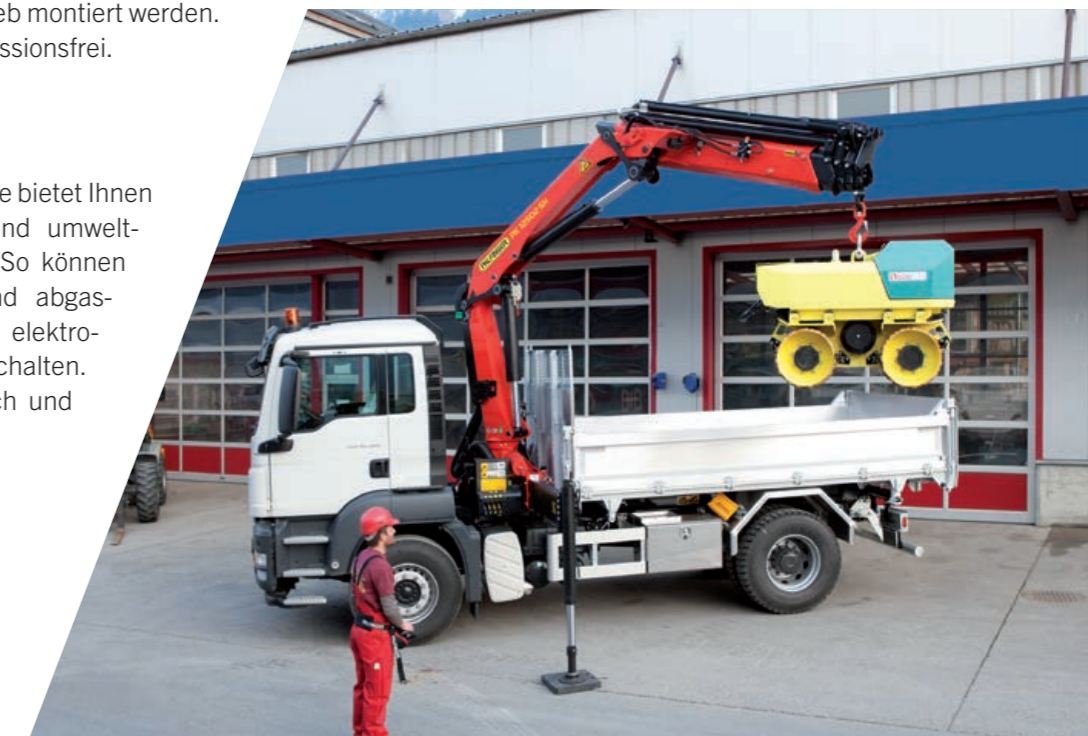
PK 12502 SH mit eDrive, auf 2-Achs-Fahrgestell