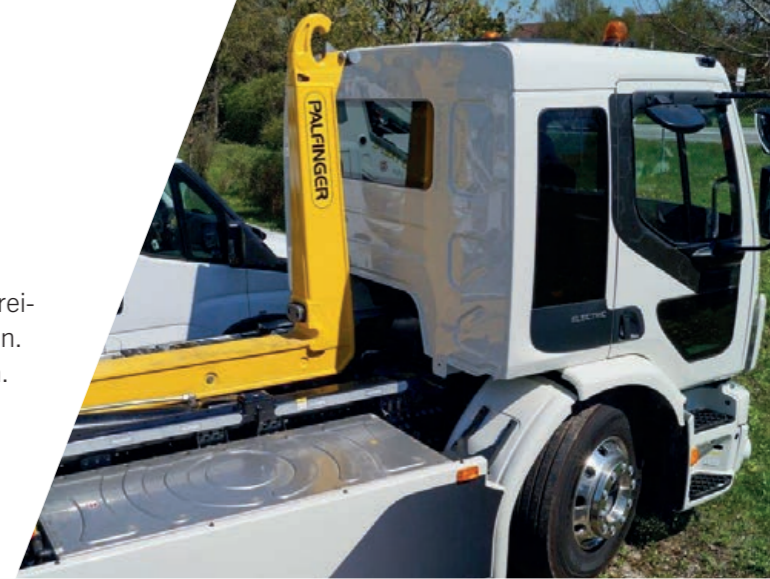
TELESCOPIC PH T20 auf 2-Achs-Fahrgestell mit Elektroantrieb

Mit Hybridantrieb für Ladekrane bietet Ihnen PALFINGER ein effizientes und umweltfreundliches Gesamtkonzept. So können Ihre Mitarbeiter in lärm- und abgasempfindlichen Bereichen auf elektrohydraulischen Antrieb umschalten. ist leistungsfähig, wirtschaftlich und viel Energie.