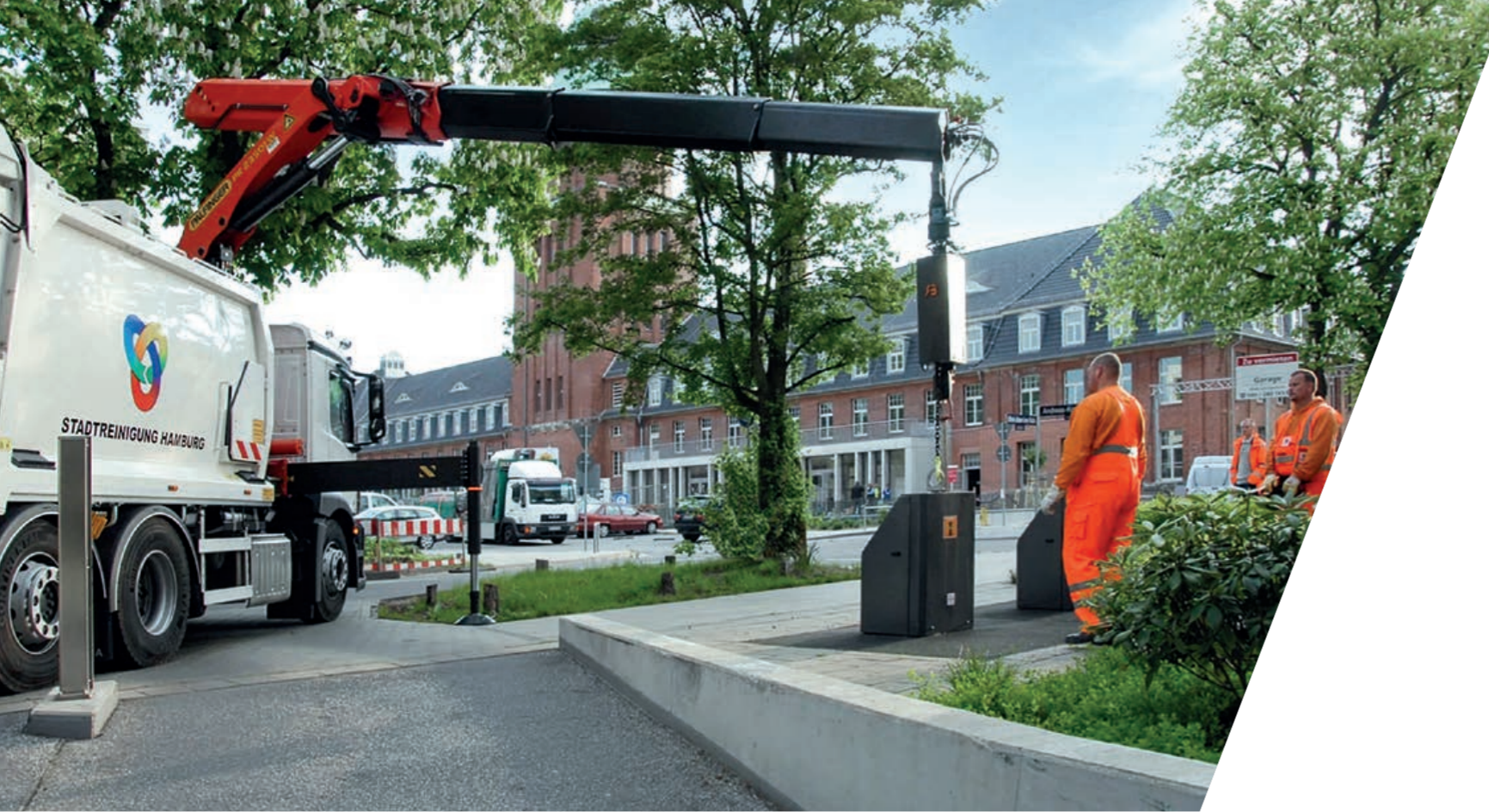
PK 23501 W auf 3-Achs-Abfallsammelfahrzeug