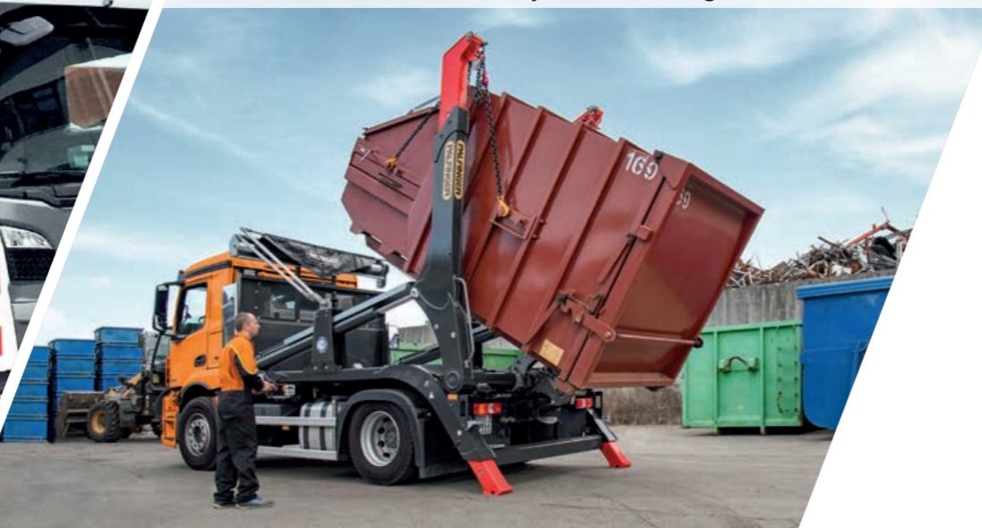
PS T 14 TEC mit PALCOVER Abdecksystem auf 18t Fahrgestell