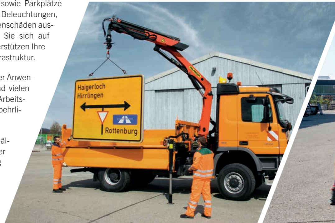
PK 9.501 SLD 5 auf 18t Krankipper

PALFINGER Hubarbeitsbühnen sind die beste Lösung für die Anbringung oder Wartung von Verkehrsanlagen wie Schilder, Ampelanlagen und Straßenbeleuchtungen. Sie leisten hervorragende Dienste bei der Fahrbahnsicherung, z. B. beim Entfernen von Ästen oder bei der Überprüfung von Abhängen auf loses Gestein. Eine Vielzahl von Assistenzsystemen unterstützen Ihren Bediener für einen effizienten und sicheren Einsatz.