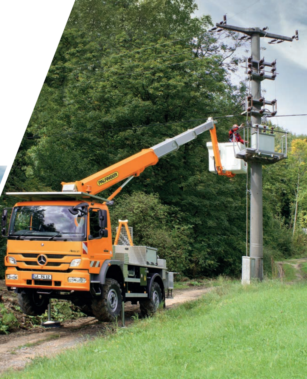
P 220 BK auf 18t Allrad-Fahrgestell