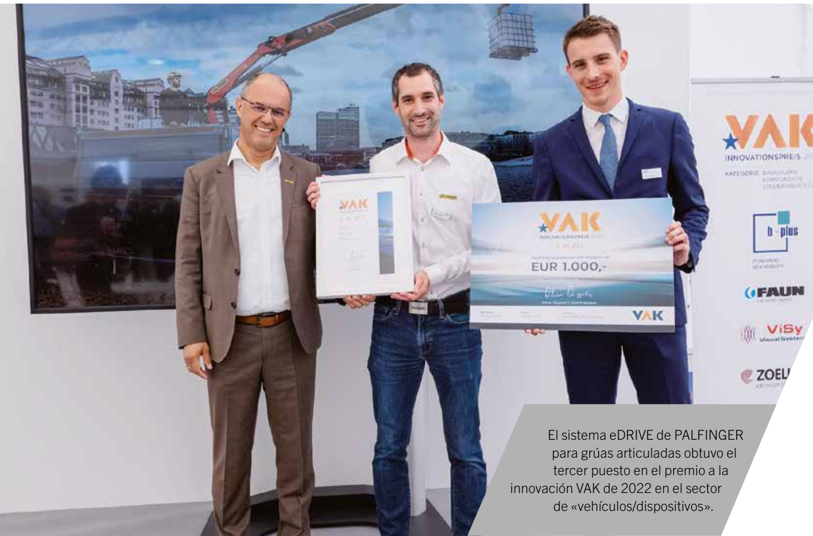
El sistema eDRIVE de PALFINGER para grúas articuladas obtuvo el tercer puesto en el premio a la innovación VAK de 2022 en el sector de «vehículos/dispositivos».