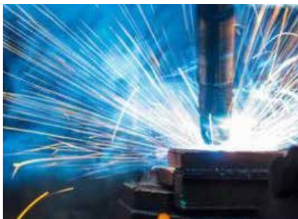
Pièces d'usure de longue durée

WWW.PALFINGER.COM/FR-FR/POINTS-VENTE-SERVICES