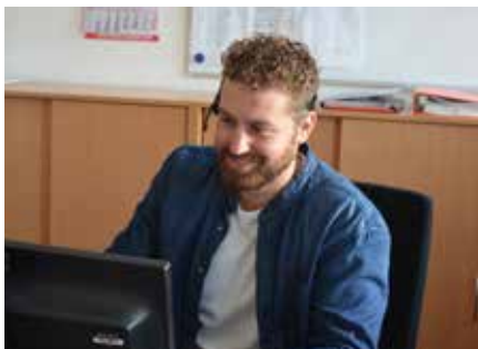
Support technique et formation

Le système de diagnostic des hayons PALFINGER fait partie de l'application de diagnostic PALFINGER (PALCODE) qui peut aider à localiser et à réparer les défauts.