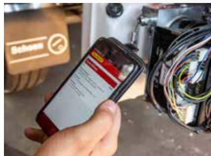
Application de service

Trouvez votre partenaire de service via la recherche web ou l'application. Plus de 300 partenaires de services en France, plus de 40 partenaires de services au Royaume-Uni et plus de 900 partenaires de services en Allemagne / Autriche / Suisse.