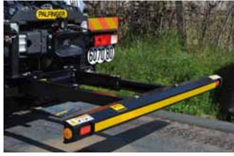
BARRE ANTI-ENCASTREMENT HYDRAULIQUE