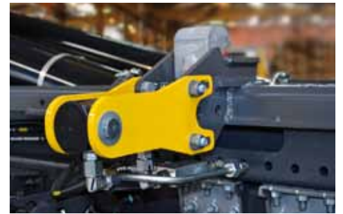
VERROUILLAGE HYDRAULIQUE AV