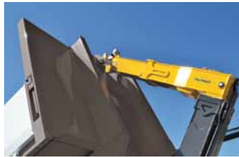
HAUTEUR DE CROCHET HYDRAULIQUE