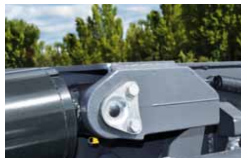
DESIGN ORIENTE CLIENT