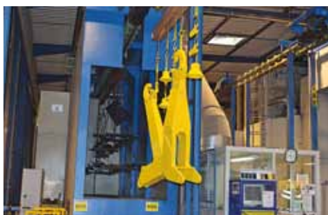
POP – PALFINGER ORIGIN PROTECTION