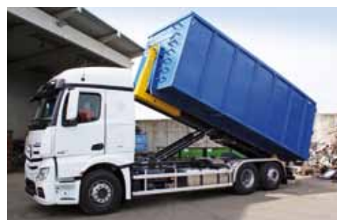
FORTE CAPACITE DE BENNAGE