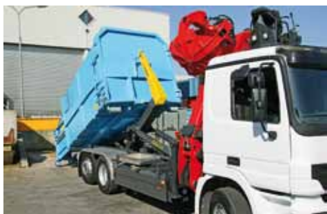
CHARGE UTILE ELEVEE