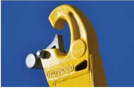
LINGUET DE SECURITE