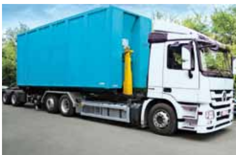
HAUTEUR DE TRANSPORT REDUITE